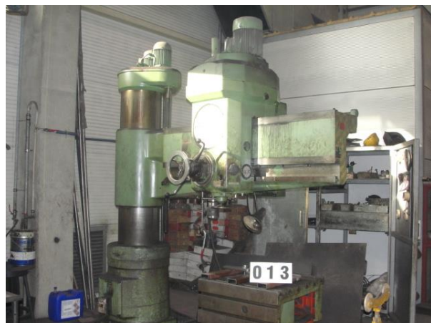
Inv.br. 13. - Stubna radijalna bušilica