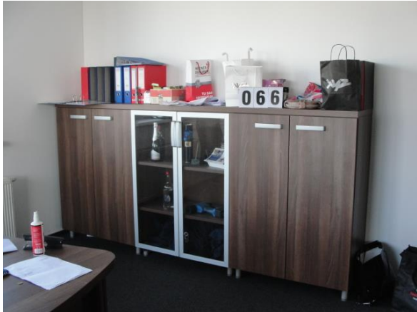
Inv.br. 66. - Ormarić trostruki