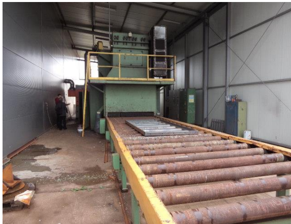
Inv.br. 21.2. - Sačmara i površinska zaštita limova dio za izlaz limova