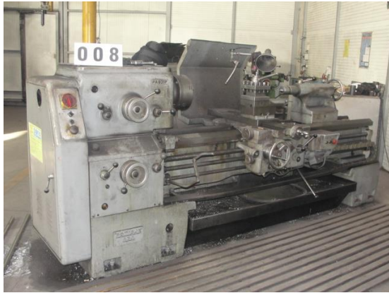
Inv.br. 08. - Tokarski stroj 300x1500 PA 631 M