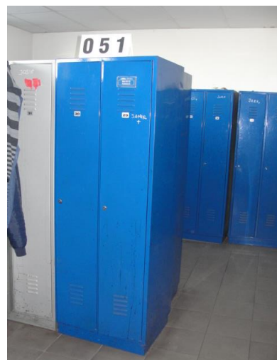
Inv.br. 51 - Garderobni ormar dvostruki