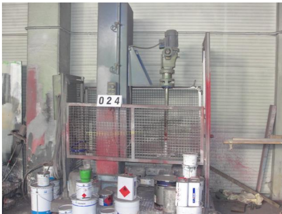
Inv.br. 24.5. - Lakirnica Eko Air uređaj za mješanje boja