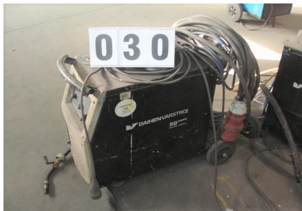
Inv.br. 30. - Aparat za zavarivanje Varmig 255