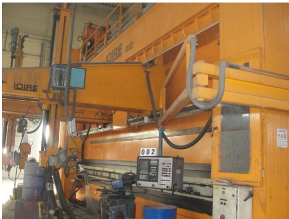
Inv.br. 02.1. - Hidraulična preša 600 tona