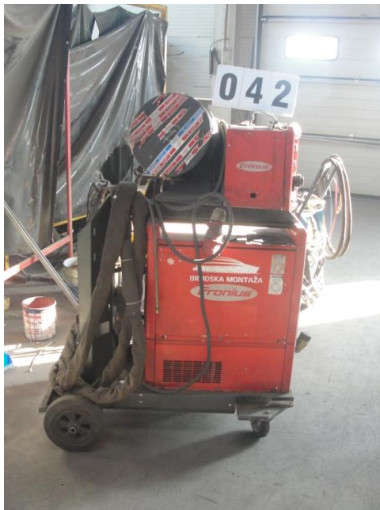
Inv.br. 42. - Aparat za zavarivanje Fronius TS 4000 Occasion, MIGTorts AW 5000-E