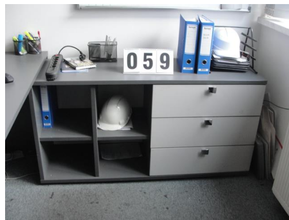
Inv.br. 59. - Radni ormarić