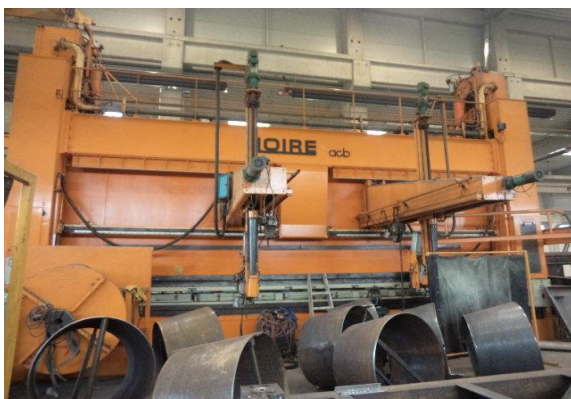
Inv.br. 02.3. - Hidraulična preša 600 tona