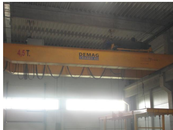
Inv.br. 16. - Kranska dizalica 2 x 4,5 tona