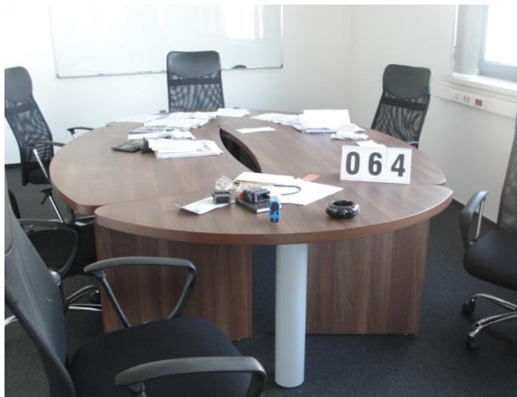
Inv.br. 64. - Ovalni stol uredski