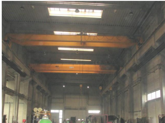
Inv.br. 05. - Kranska dizalica 1x10 tona