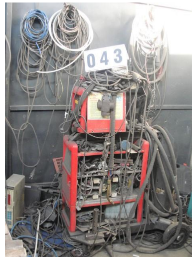
Inv.br. 43. - Aparat za zavarivanje Fronius TS 4000 Occasion, MIGTorts AW 5000-E