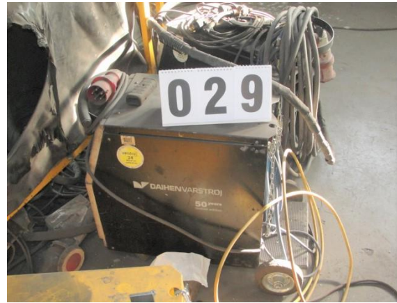
Inv.br. 29. - Aparat za zavarivanje Varmig 254