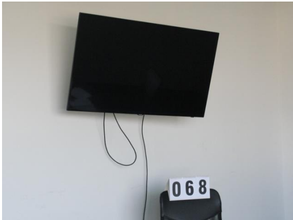
Inv.br. 68. - Televizor Led Smart