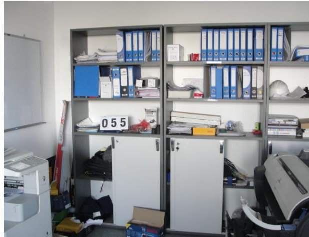
Inv.br. 55. - Ormari visoki