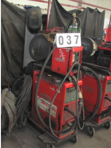
Inv.br. 37. - Aparat za zavarivanje Fronius TS 4000 Occasion, MIGTtoorts AW 5000-E