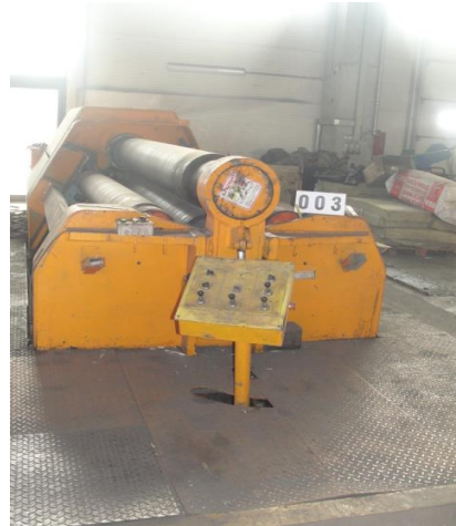
Inv.br. 03.2. -Hidraulični valjci za savijanje