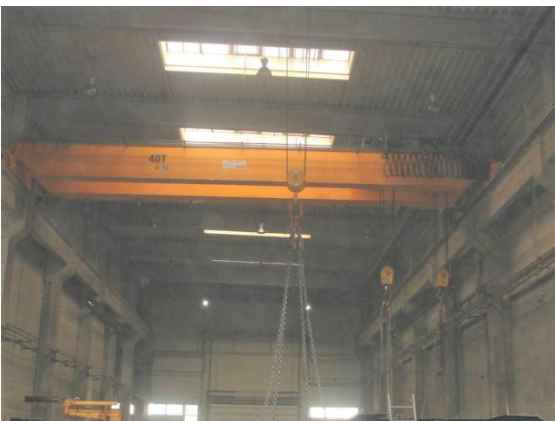
Inv.br. 06. - Kranska dizalica 2x40 tona