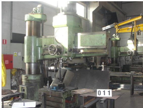
Inv.br. 11. - Stubna radijalna bušilica