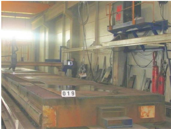
Inv.br. 19.1. - Uređaj za rezanje metala plazmom pogled na izvršni dio uređaja