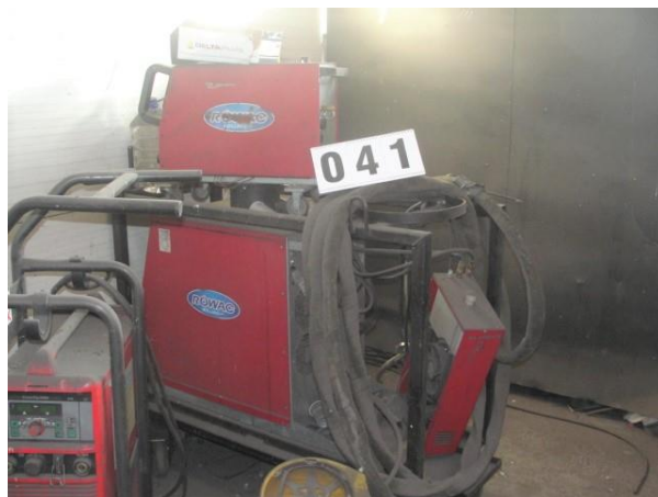
Inv.br. 41. - Aparat za zavarivanje Rowac 200 ES