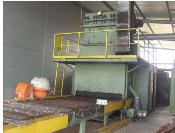
Inv.br. 21.1. - Sačmara i površinska zaštita limova dio za ulaz limova