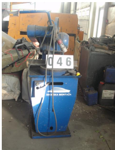
Inv.br. 46. - Pila tirolitka