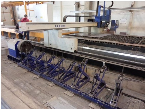
Inv.br. 19.3. - Uređaj za rezanje metala plazmom manipulator za kružno rezanje