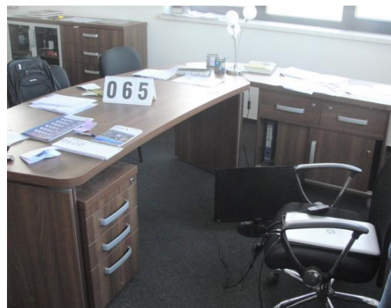
Inv.br. 65. - Uredski radni stol