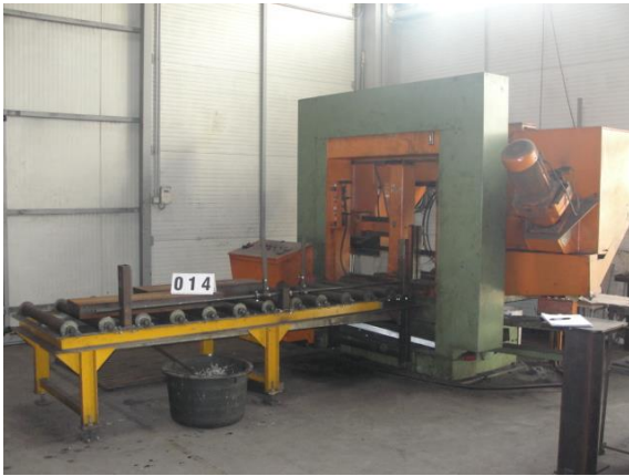
Inv.br. 14.1. - Portalna tračna pila