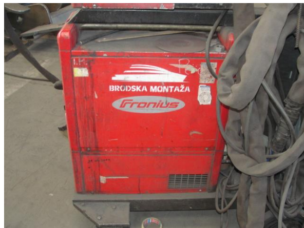
Inv.br. 39. 2. - Aparat za zavarivanje Fronius TS 4000 Occasion, MIGTtoorts AW 5000-E