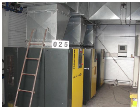
Inv.br. 25.1. - Kompresorska stanica pogled na tri kompresora