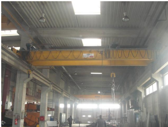
Inv.br. 15. - Kranska dizalica 2 x 5 tona