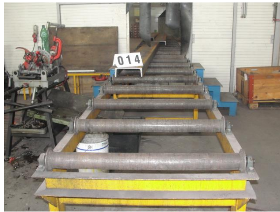
Inv.br. 14.2. - Portalna tračna pila