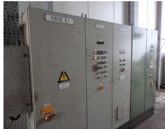
Inv.br. 21.3. - Sačmara i površinska zaštita limova upravljački elektro ormari