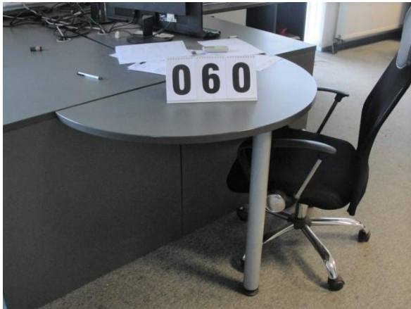
Inv.br. 60. - Polukružni dodatak stolu