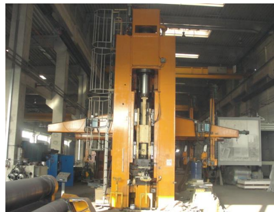
Inv.br. 02.2. - Hidraulična preša 600 tona