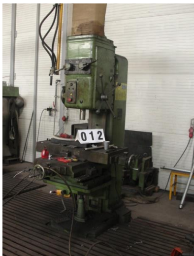
Inv.br. 12. - Stubna bušilica