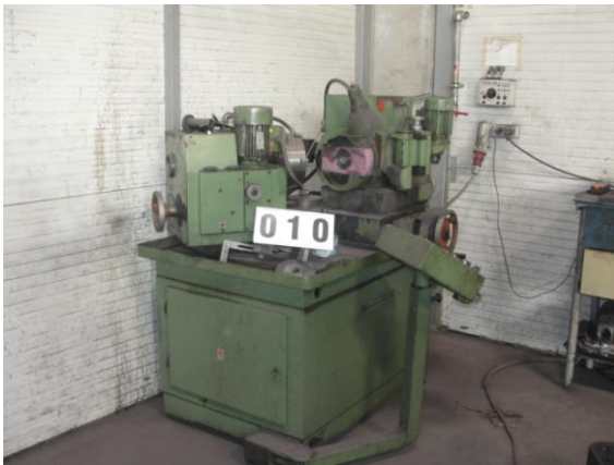
Inv.br. 10. - Oštrilica alata