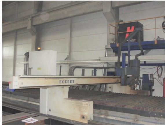
Inv.br. 19.2. - Uređaj za rezanje metala plazmom nosac jedinice za rezanje plazmom