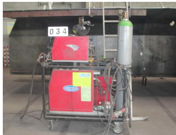
Inv.br. 34. - Aparat za zavarivanje Rowac 200 ES