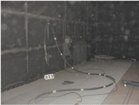
Inv.br. 23.1. - Ručna sačmara za lakirnicu unutrašnjost sačmare i ručni pištolj