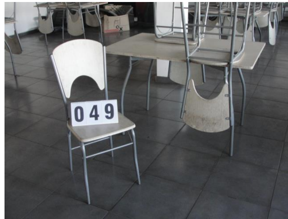
Inv.br. 49. - Stolicice u menzi