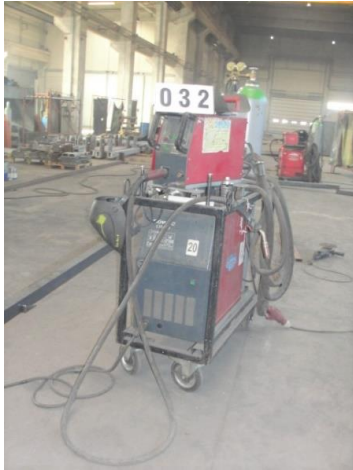
Inv.br. 32. 1. - Aparat za zavarivanje Rowac 200 ES