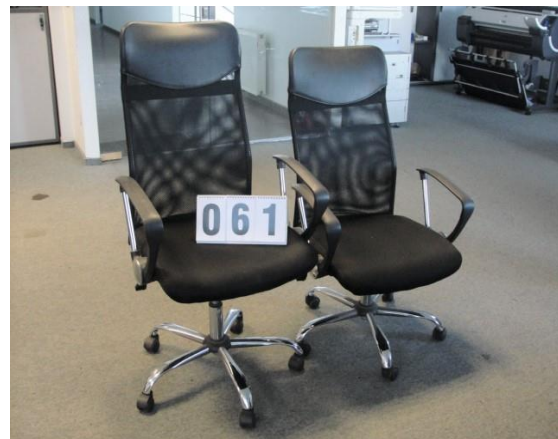
Inv.br. 61. - Kancelarijske radne stolice