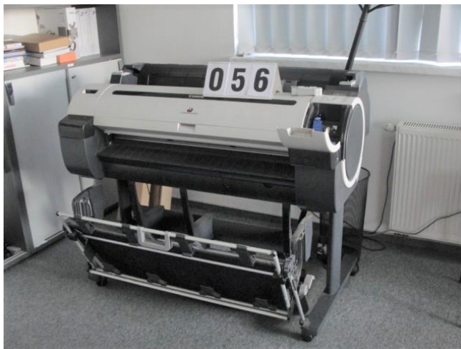
Inv.br. 56. - Ploter L =