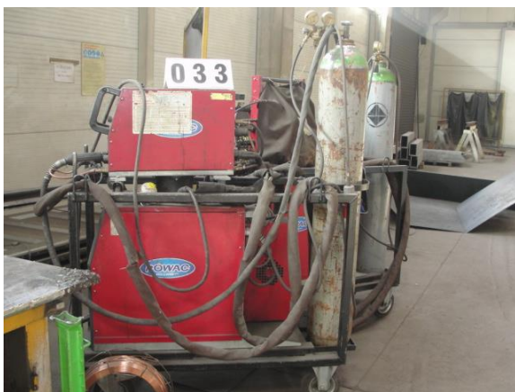
Inv.br. 33. - Aparat za zavarivanje Rowac 200 ES