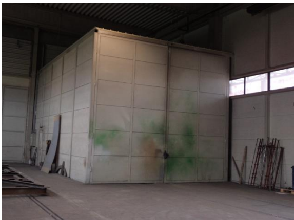
Inv.br. 23.3. - Ručna sačmara za lakirnicu vanjski pogled na kabinu sačmare