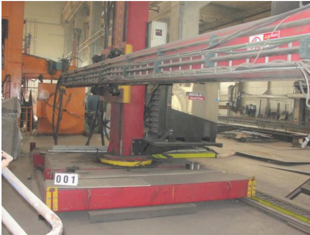
Inv.br. 01.1. - Linijski robot za zavarivanje