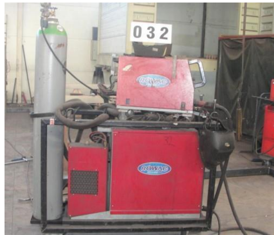
Inv.br. 32. 2. - Aparat za zavarivanje Rowac 200 ES