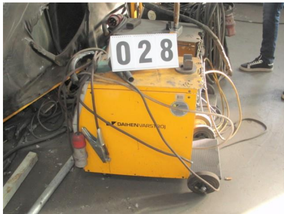
Inv.br. 28. - Aparat za zavarivanje Varmig 253