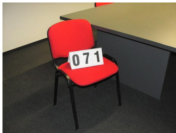
Inv.br. 71.- Konferencijska stolica