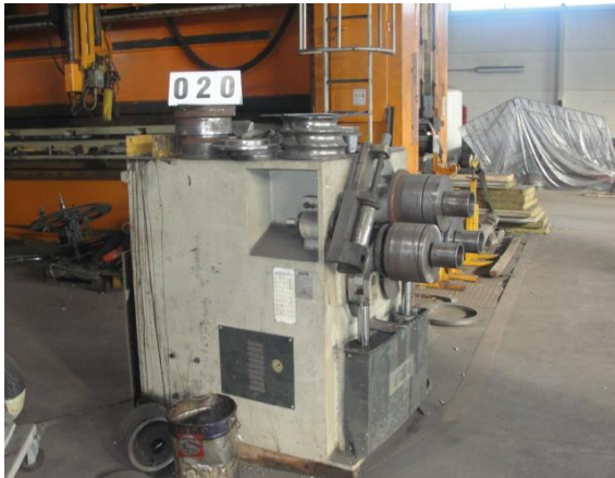
Inv.br. 20. - Valjci za profile