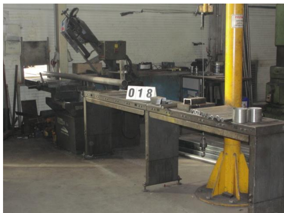
Inv.br. 18. - Tračna pila Mep Shark