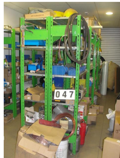
Inv.br. 47. - Skladišne police, 105x44x200 cm