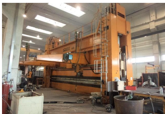
Inv.br. 02.4. - Hidraulična preša 600 tona