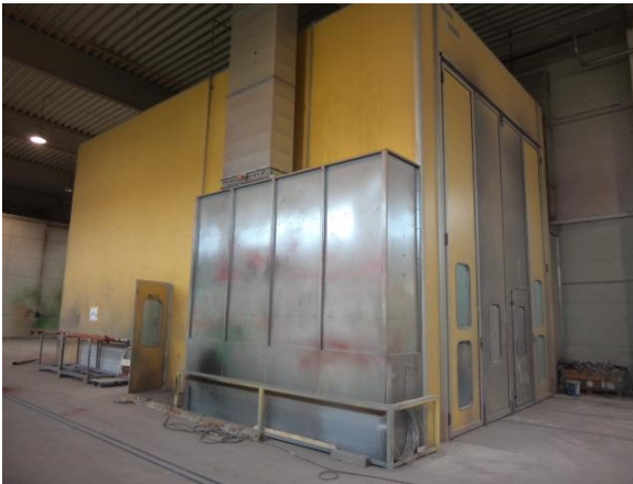
Inv.br. 24.3. - Lakirnica Eko Air vanjski pogled na kabinu lakirnice - straga