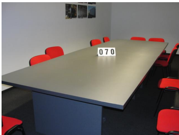
Inv.br. 70. - Konferencijski stol