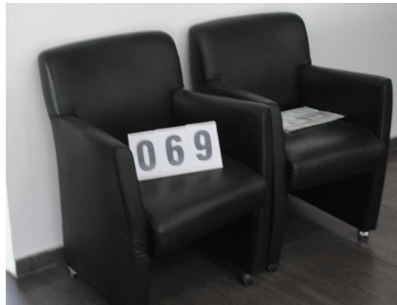
Inv.br. 69. - Fotelje