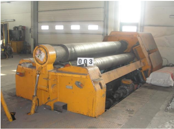
Inv.br. 03.1. -Hidraulični valjci za savijanje