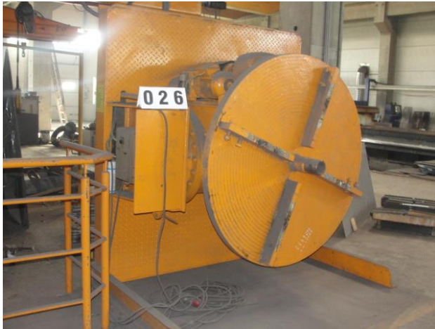
Inv.br. 26. - Pozicioner za kružno zavarivanje