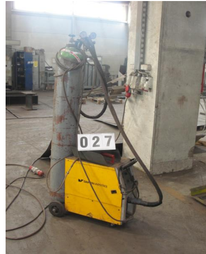
Inv.br. 27. - Aparat za zavarivanje Varmig 252