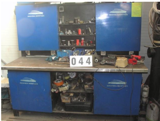
Inv.br. 44. - Radni stol i ormar za alat