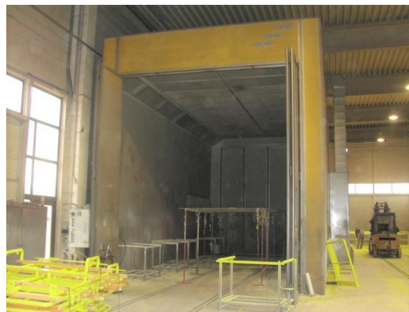
Inv.br. 24.2. - Lakirnica Eko Air vanjski pogled na kabinu lakirnice - sprijeda