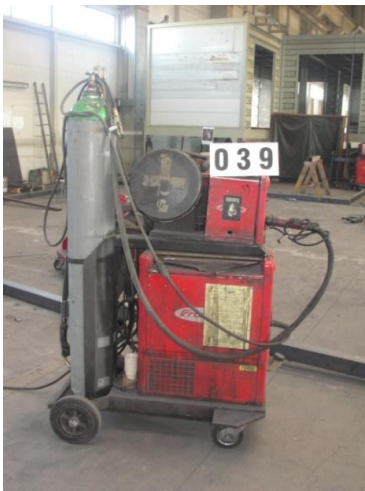
Inv.br. 39. 1. - Aparat za zavarivanje Fronius TS 4000 Occasion, MIGTtoorts AW 5000-E