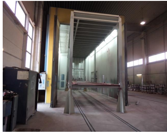
Inv.br. 24.4. - Lakirnica Eko Air unutrašnjost kabine lakirnice