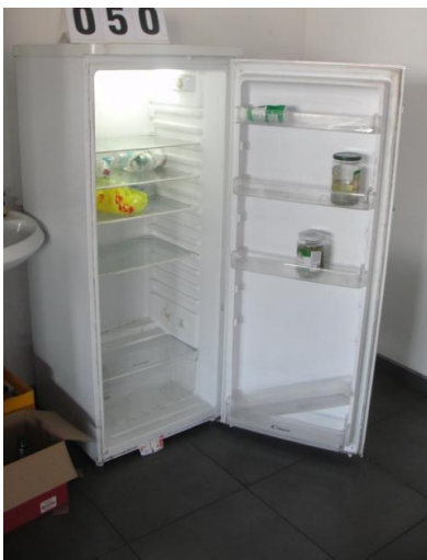
Inv.br. 50. - Frižider Candy u menzi