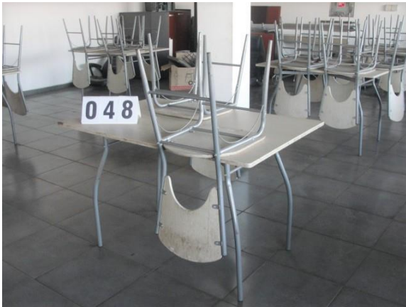
Inv.br. 48. - Stolovi u menzi, 80x120 cm