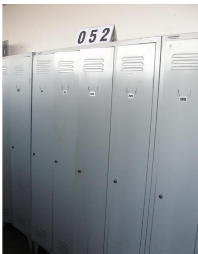
Inv.br. 52 - Garderobni ormar četverostruki