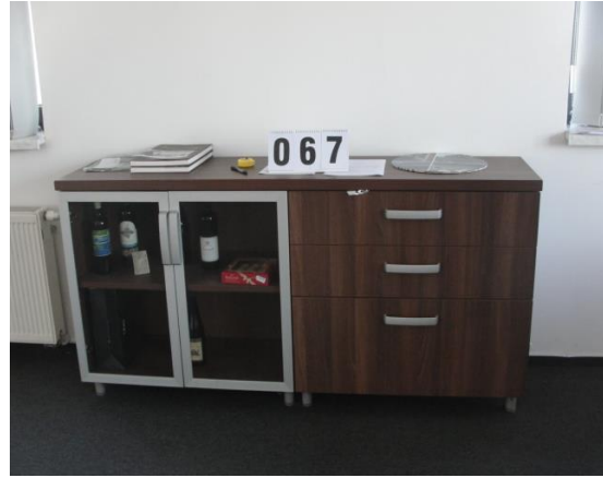
Inv.br. 67. - Ormarić dvostruki