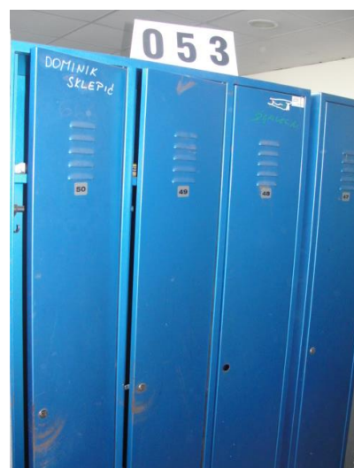
Inv.br. 53 - Garderobni ormar trostruki