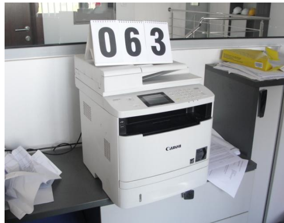
Inv.br. 63. - Kopirni aparat A4 stolni Canon