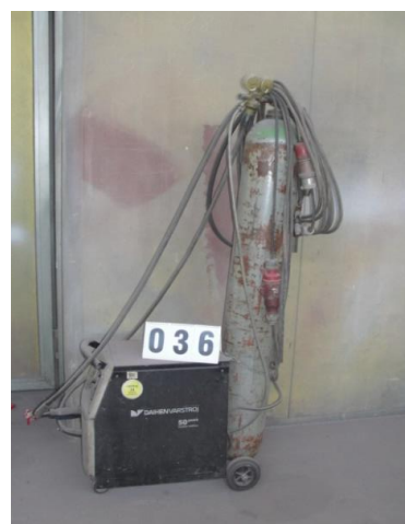
Inv.br. 36. - Aparat za zavarivanje Varmig 256