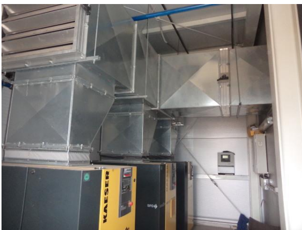
Inv.br. 25.2. - Kompresorska stanica cjevovodni sustav ventilacije