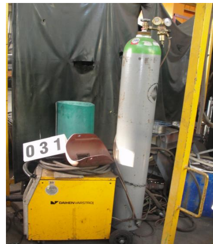
Inv.br. 31. - Aparat za zavarivanje Varmig 256