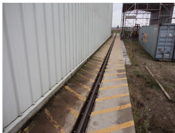
Inv.br. 22.2. - Vanjski portalni kran od 10 tona tračnice kрана