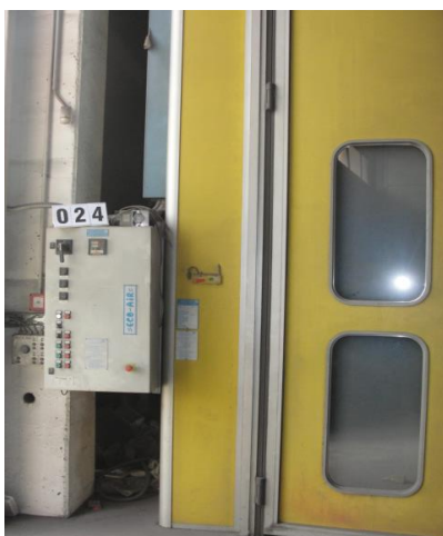
Inv.br. 24.1. - Lakirnica Eko Air upravljački dio lakirnice