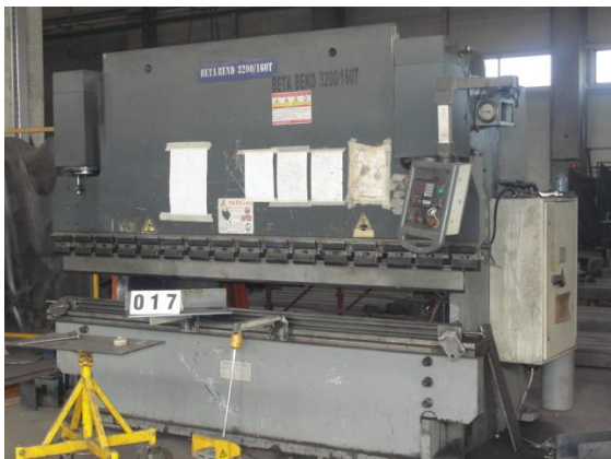
Inv.br. 17. - Hidraulična preša