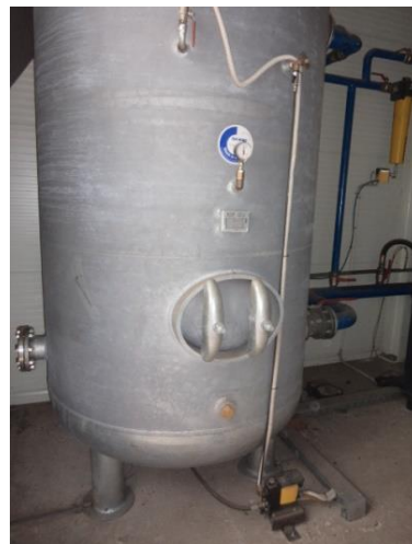
Inv.br. 25.3. - Kompresorska stanica spremnik komprimiranog zraka