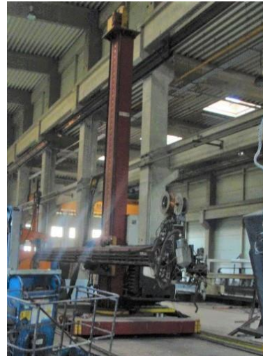
Inv.br. 01.2. - Linijski robot za zavarivanje