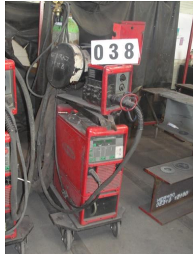
Inv.br. 38. - Aparat za zavarivanje Fronius TS 4000 Occasion, MIGTtoorts AW 5000-E