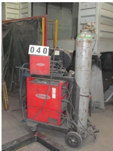
Inv.br. 40. - Aparat za zavarivanje Fronius TS 4000 Occasion, MIGTtoorts AW 5000-E