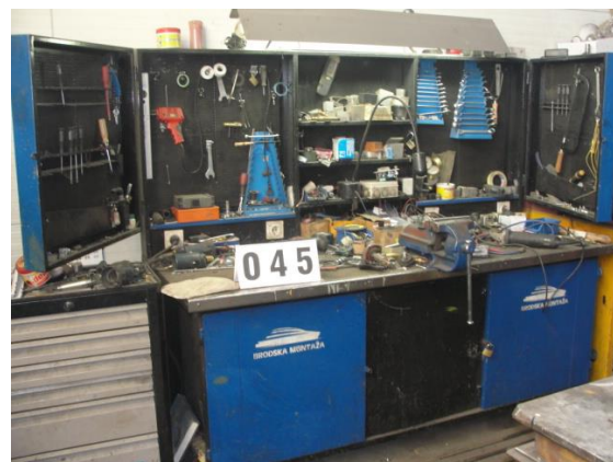
Inv.br. 45. - Radni stol i ormar za alat s škripcom