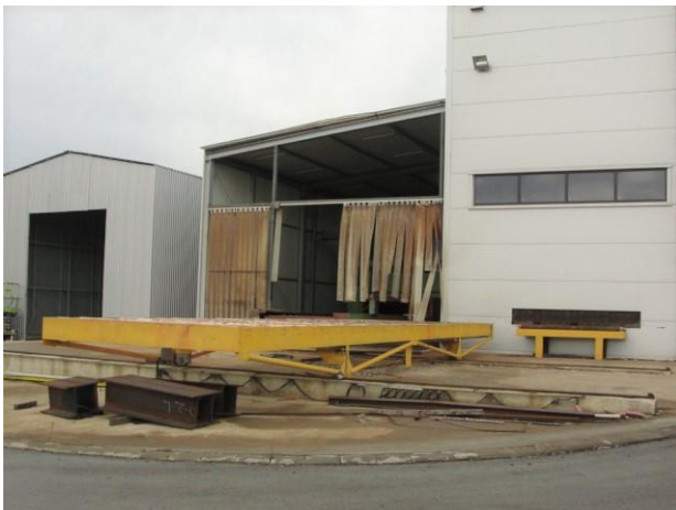
Inv.br. 19.5. - Uređaj za rezanje metala plazmom prijenosni transporter limova