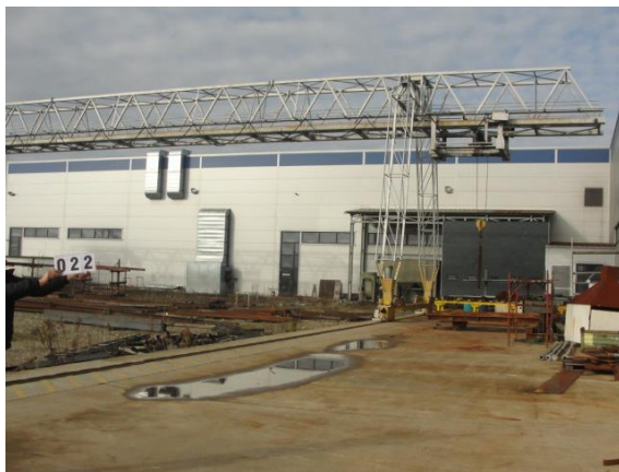
Inv.br. 22.1. - Vanjski portalni kran od 10 tona pogled na dio kрана