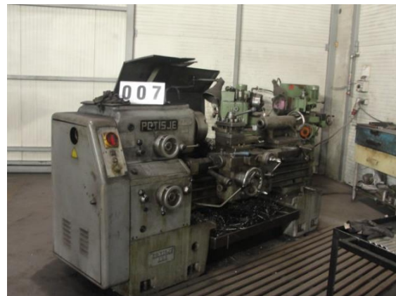
Inv.br. 07. - Tokarski stroj 200x800 PA 501 M