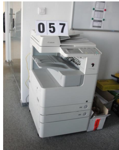
Inv.br. 57. - Kopirni aparat A3 samostojeći