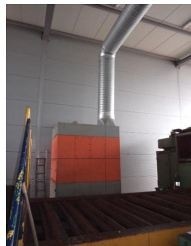
Inv.br. 19.6. - Uređaj za rezanje metala plazmom odsis plinova od rezanja