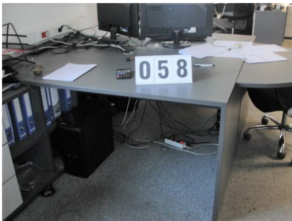
Inv.br. 58. - Kancelarijski radni stol