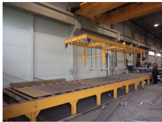
Inv.br. 19.4. - Uređaj za rezanje metala plazmom pneumatski podizni alat za limove