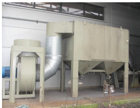
Inv.br. 23.4. - Ručna sačmara za lakirnicu oprema za regeneraciju sačme