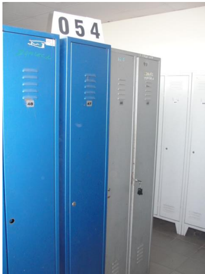
Inv.br. 54. - Garderobni ormar jednostruki