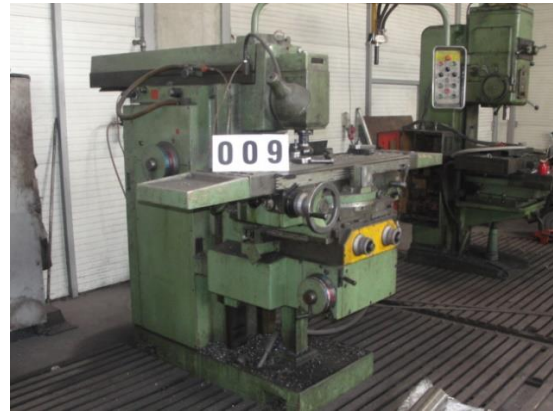
Inv.br. 09. - Konzolna univerzalna glodalica