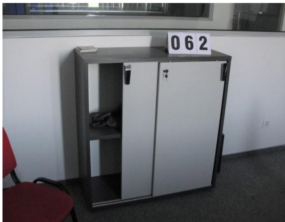
Inv.br. 62. - Ormar niski