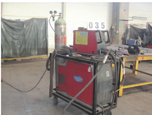
Inv.br. 35. - Aparat za zavarivanje Rowac 200 ES